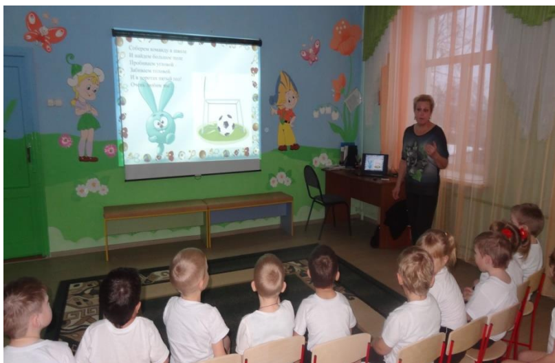
Дидактическая игра « Угадай вид спорта»

Интересно прошли спортивные праздники : « В гости к Айболиту», «Гномы и Белоснежка» , «Физкульт – Ура !» , « Праздник здоровья» . Дети выполняли задания сказочных героев , лихо преодолевая трудности . Все участники получили витаминные призы , а так же положительные эмоции и заряд энергии