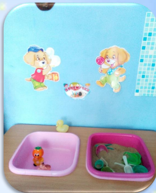
Центр «Песка и воды»