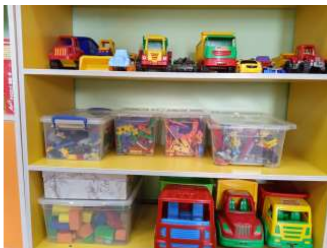
«Гараж» Центр конструирования и строительных игр