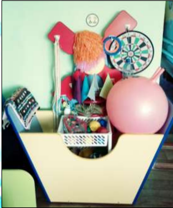
Центр физкультуры и ЗОЖ