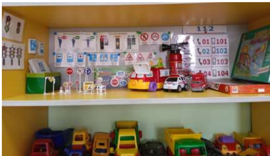
Центр безопасности и ПДД

Пространство группы построено таким образом, что бы оно давало возможность построения непересекающихся сфер активности . Это позволяет детям в соответствии со своими интересами и желаниями заниматься одновременно разными видами деятельности , не мешая друг другу