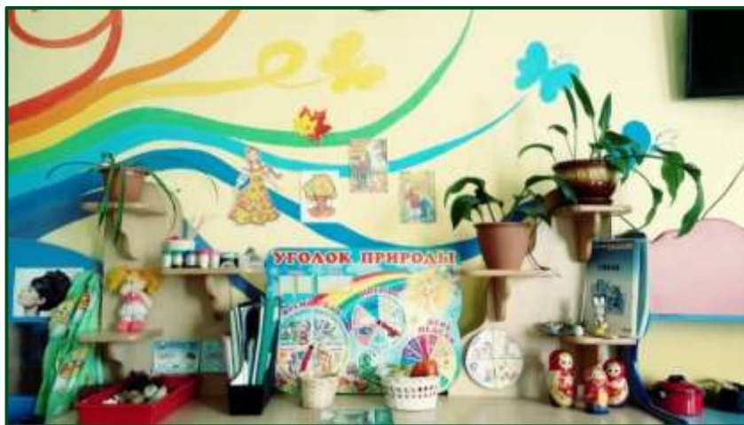
«Центр природы и эксперимента»