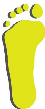
Плоскостопие 1ая степень