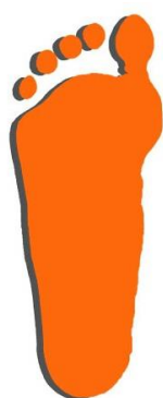
Плоскостопие 2ая степень